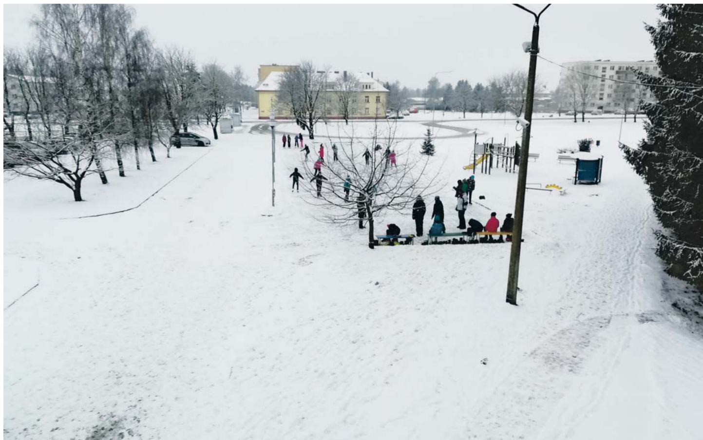
Uisuplats Loo kooli ees.

Neeme küla uisuplats asub Neeme Pood & Kohviku tagusel platsil, uisuväli valmis kodanikualgatuse koostöös Neeme Pood & Kohviku ning Neeme Päästeseltsiga. Suur tänu!