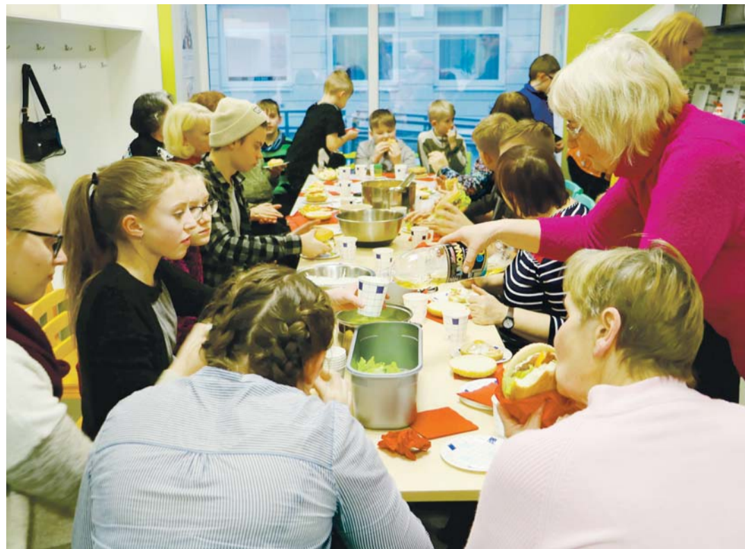
Valla noored ja eakad kohtusid juba teist korda. Seekord meisterdati burgereid.

Järgmine kord on taas Pihlakobara kord noori võõrustada ja juba on paigas ka suvised ühised piknikuplaanid.