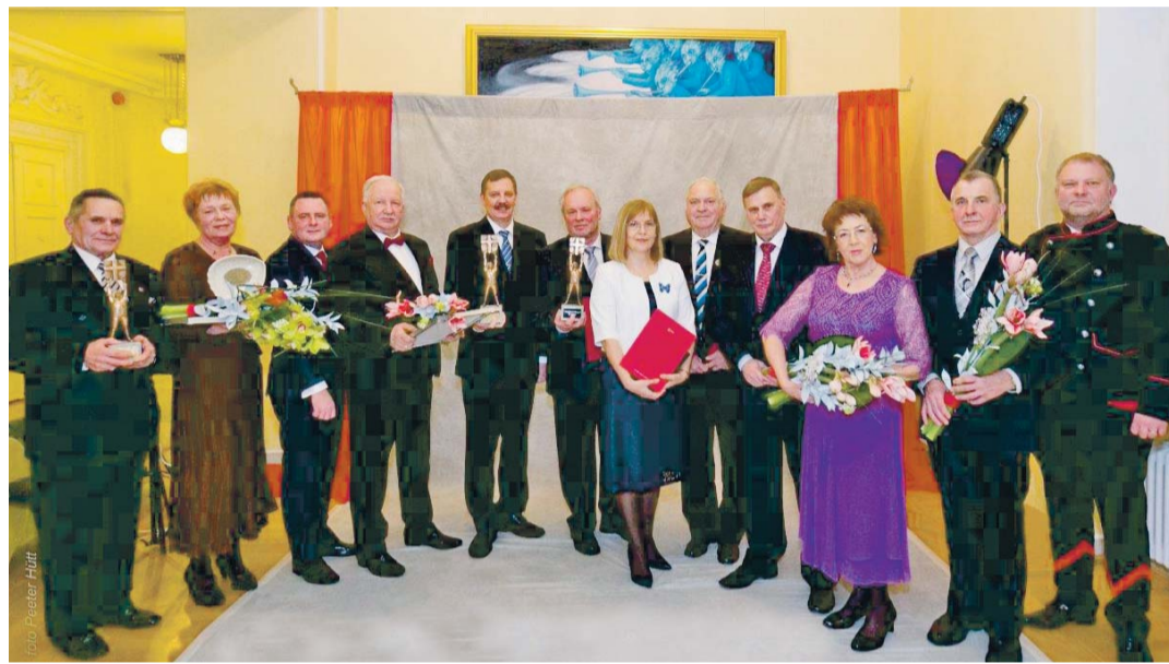
Harjumaa silmapaistvate isikute autasustamine Harjumaa Ballil.

Väikest Holmerit antakse välja omavalitsuse volikogu liikmele, linnavalitsuse/vallavalitsuse (ametiasutusena) ja HOL büroo teenistujale/töötajale teenete eest konkreetse valla/linna või omavalitsuste koostöö arendamisel.