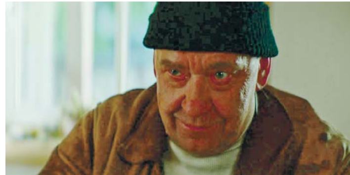
Kaader filmist „Rohelised kassid”.