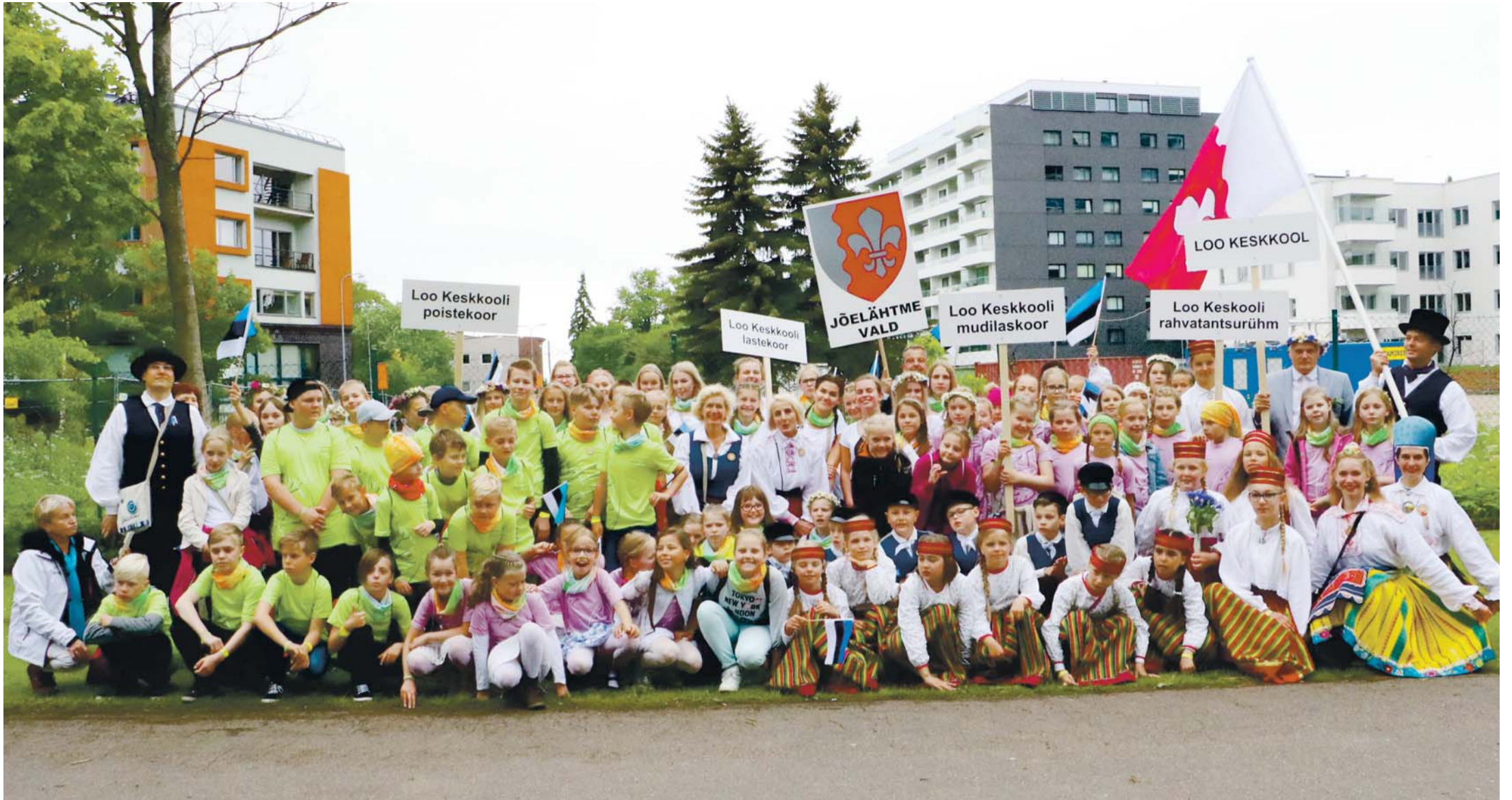
Valla noored XII noorte laulu- ja tantsupeol.