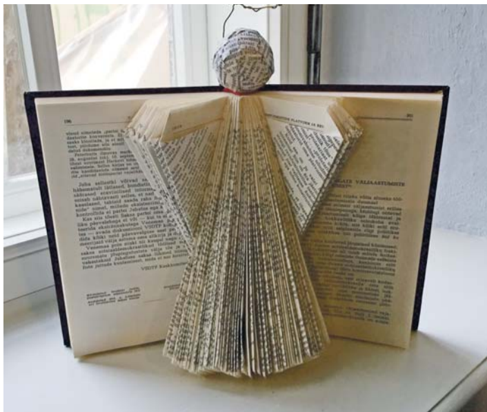
Noorte dekoraatorite ringis meisterdatud kaunistus.