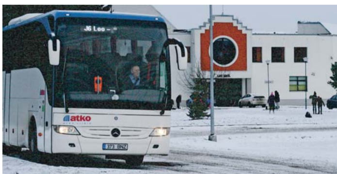
J6 koolibuss Loo kooli ees.

Koostöös Harjumaa Ühistranspordikeskusega töötas vallavalitsus välja uue lahenduse, mis pikendab J6 liini mitte ainult Kostiranna külanii, vaid ka Manniva ja Uus-Rebala külanii ning sealt edasi sõidab J6 otse tagasi Loolle. Nii jäävad kõik koolibusside väljumised Loolt