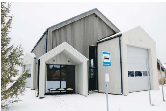
Kaberneeme vabatahtlike maa- ja merepääste depoohoone.